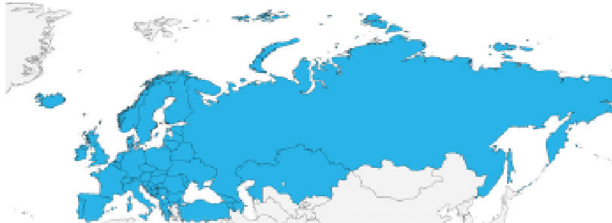
European Higher Education Area and Bologna Follow-Up Group